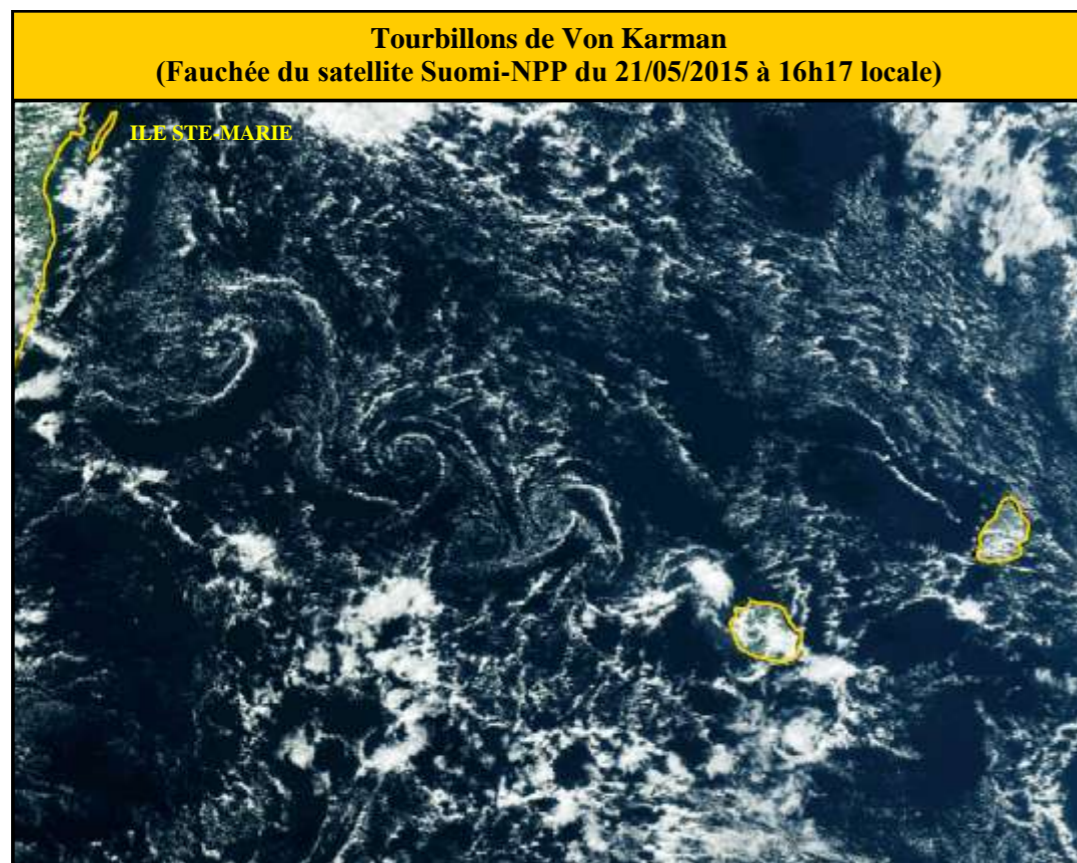
Tourbillons de Von Karman (Fauchée du satellite Suomi-NPP du 21/05/2015 à 16h17 locale)